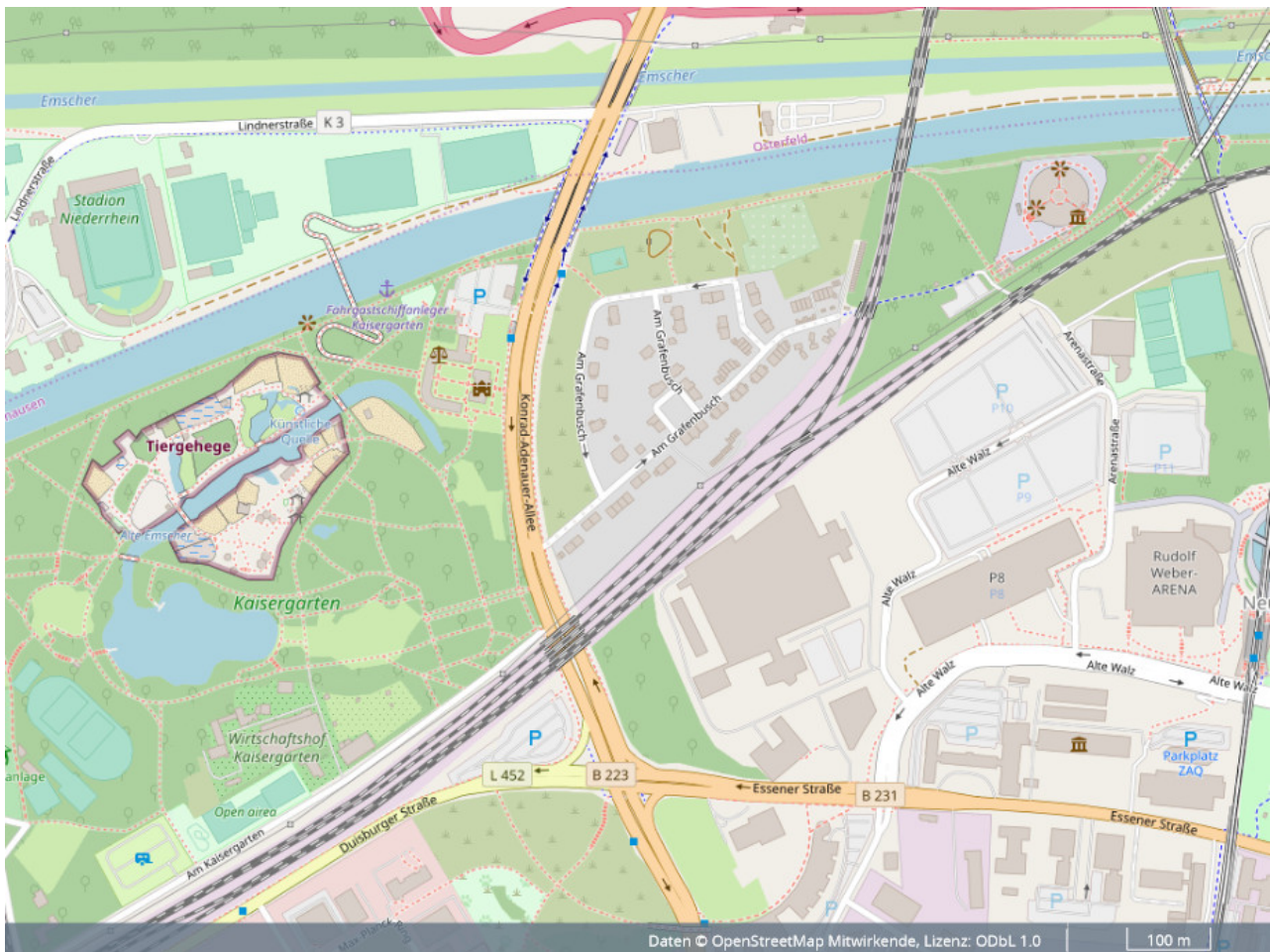
Bild aus Kartenansicht