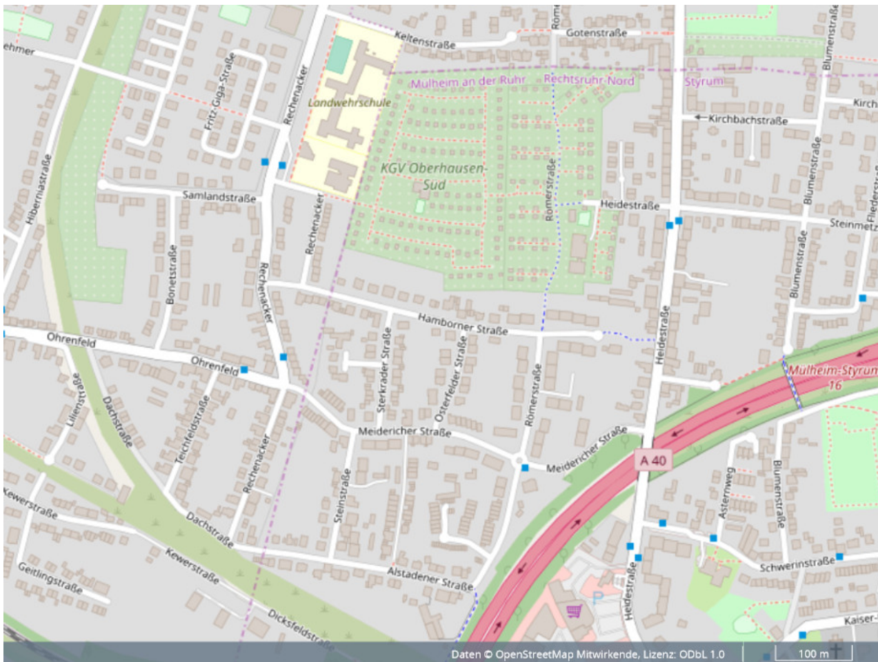
Bild aus Kartenansicht